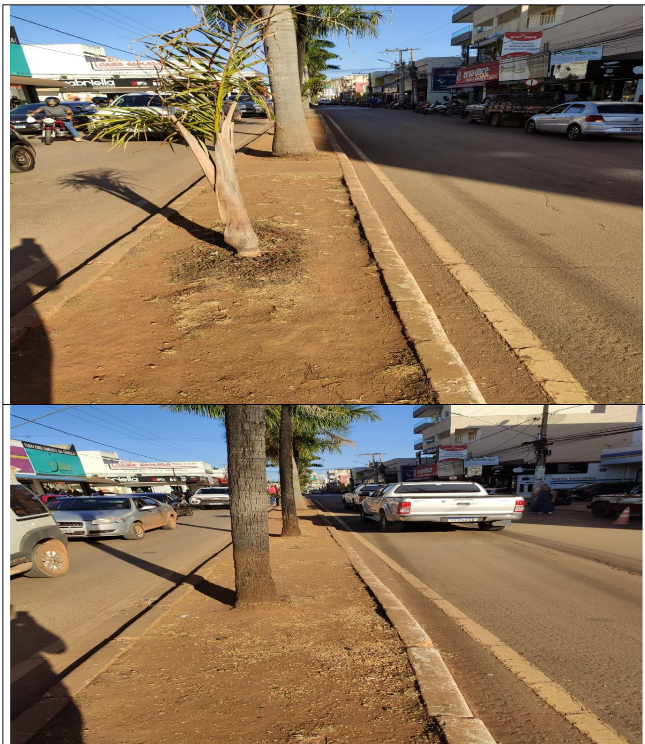
Avenida Governador Valadares em frente ao nº 860 Centro Unaí MG

https://www.google.com/maps/place/Av.+Gov.+Valadares,+860+-+Centro,+Una%C3%AD+-+MG,+38610-014/@-16.3608476,-46.9060152,17z/data=!3m1!4b1!4m6!3m5!1s0x9357a980665e70d5:0x4535230bdbb3bf20!8m2!3d-16.3608476!4d-46.9038265!16s%2Fg%2F11csj6nxlv?entry=ttu