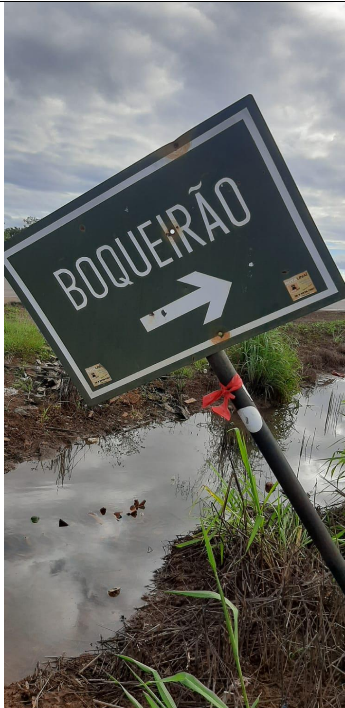
Entrada do Boqueirão (Rabo Fino – Fazenda Pico) às margens da Rodovia Estadual Arinos/Burititis LMG-628 sentido ao Distrito de Garapuava.