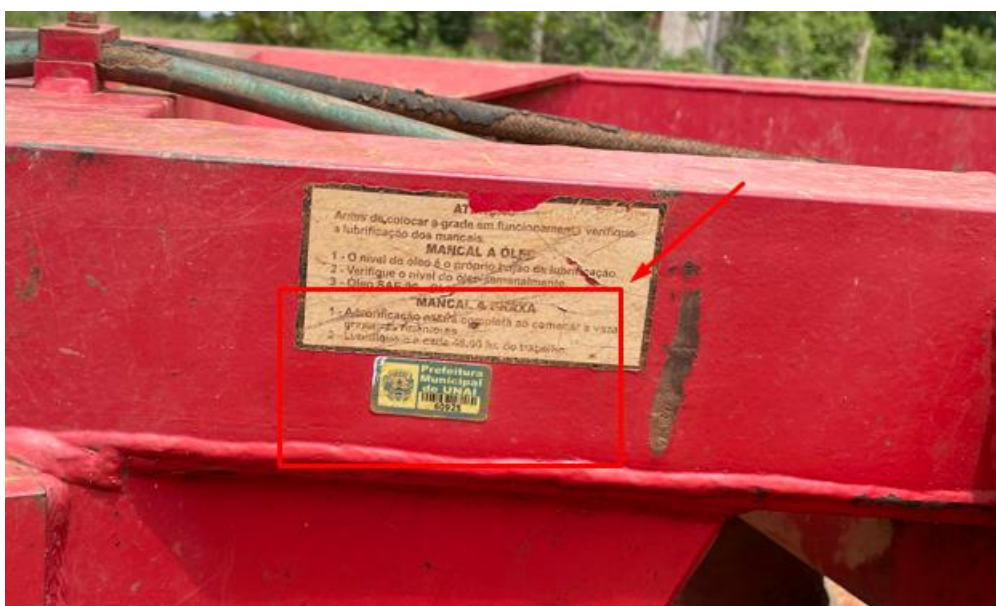
SUBSCRIÇÃO NA GRADE: PATRIMÔNIO 60.925