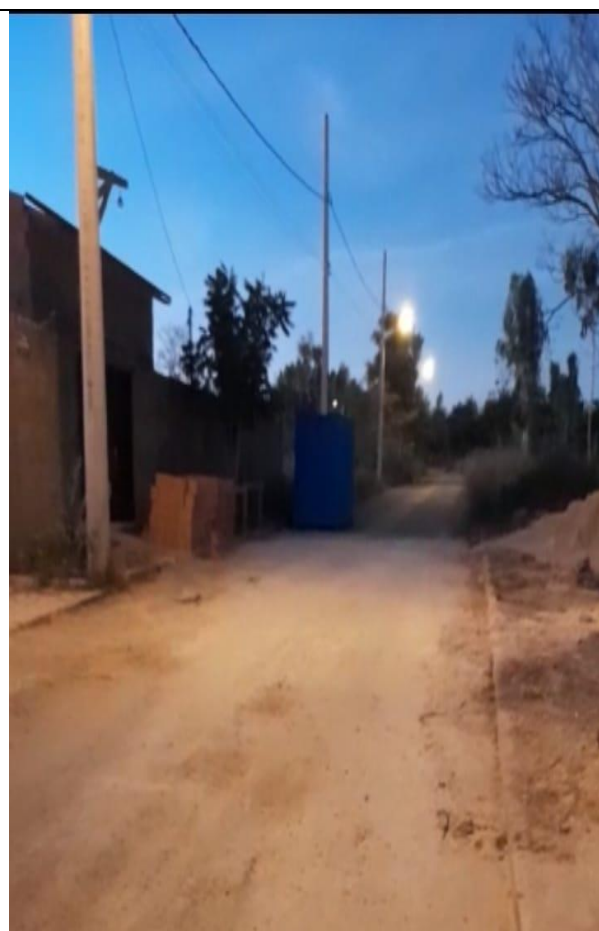
RUA DO RIO – BAIRRO ÁGUA BRANCA – UNAÍ/MG