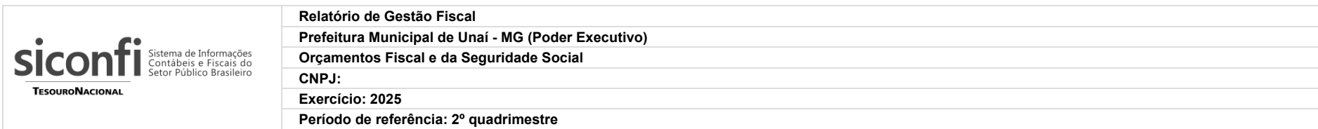
RGF-Anexo 03 | Tabela 3.0 - Demonstrativo das Garantias e Contragarantias de Valores