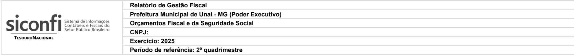
RGF-Anexo 02 | Tabela 2.1 - Trajetória de Retorno ao Limite da Dívida Consolidada Líquida - Estados, DF e Municípios