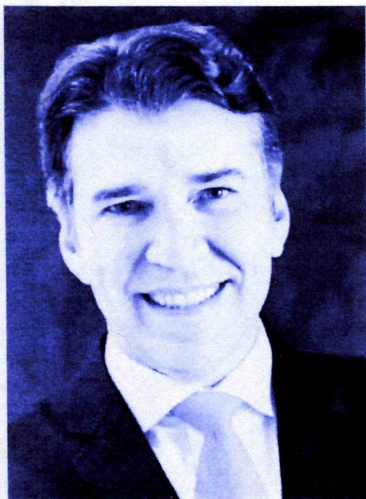
Jarbas Soares Júnior

Atualmente, exerce o cargo de procurador-geral de Justiça, tendo sido empossado no dia 12 de dezembro de 2022.