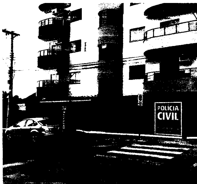
Caso está sob responsabilidade da Deam de Unaí