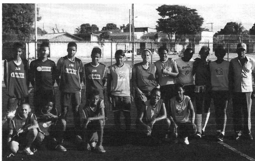
1º Campeonato de Futebol dos alunos da Escolinha Projeto Gol de Ouro da Paz.

Fonte: arquivo pessoal do homenageado - ano: 2013.